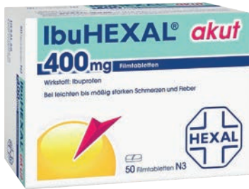
IbuHexal 400 mg akut Schmerztabletten 50 Stk. */***