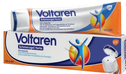
Voltaren Schmerzgel forte 150 g *