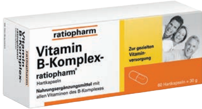
Vitamin B-Komplex Ratiopharm 60 Kaps. *