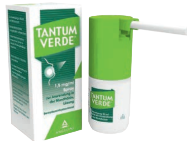
Tantum Verde 240 ml *