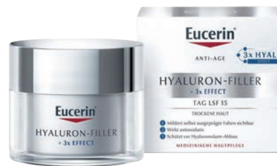
Eucerin Anti Age Hyaluron Filler Tag, trockene Haut 50 ml. *