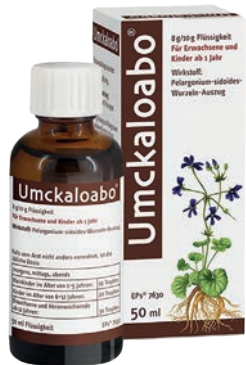
Umckaloabo 20 ml *