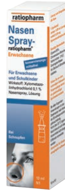
Nasenspray Ratiopharm Erw. 10 ml *