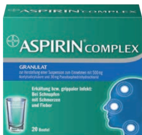
Aspirin Complex 20 Stk. */***